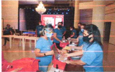
Jantar desde um pequeno vir reinventado

O tradicional Jantar Noite Feliz, realizado anualmente, em prol da Apae Novo Hamburgo também se reinventou neste ano, por causa da pandemia. O evento, que está em sua 24ª edição, partiu do seu tradicional local, o Hotel Swan Tower, e foi para a casa de cada participante nesta sexta-feira (4).